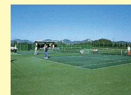
テニスコート（有料） 全天候型人工芝4面

公園外の久末ダムの外周1,350mのコース。 四季折々の景色や鳥の声をしみながら散歩や ジョギングが楽しめます。