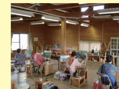
2号棟 面積：96㎡、用途：絵画等