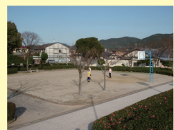
多目的広場3 バスケットゴールを備えています。