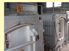
陶芸窯 2基あり、用途：素焼・本焼