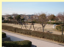
子ども広場 遊具を備え、ファミリーで満喫することができます。

国道495号線沿いに位置し、子どもから高齢者までの幅広い層の方々がそれぞれの目的で趣味を満喫できる公園です。陶芸などの文化施設が充実して、文化活動を楽しめます。子どもに大人気の遊具広場や多目的広場は心身のリフレッシュの場として、また世代を超えた心の交流の場として親しまれています。