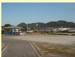
多目的広場1 ゲートボールなど様々な遊びを楽しむことができます。東屋で一休み。