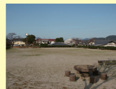
多目的広場2 公園内に3つある多目的広場の中で一番広い広場です。