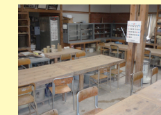
1号棟 面積：74㎡、用途：陶芸等