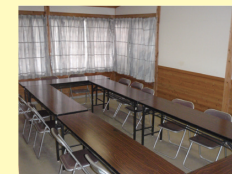
会議室 面積：23㎡、机6台・イス18脚