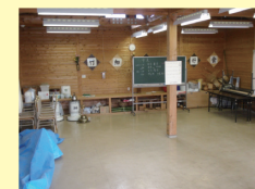
3号棟 面積：77㎡、用途：竹細工等